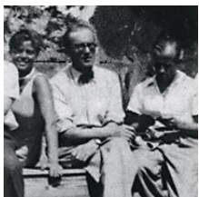
Le Corbusier, Pierre Jeanneret, Charlotte Perriand

Nel 1922 Le Corbusier dà inizio ad una attività professionale presso il nuovo atelier di rue de Sèvres a Parigi insieme al cugino Pierre Jeanneret col quale condivide ricerche e criteri di progettazione con intesa profonda e duratura, testimoniata per tutta la vita.