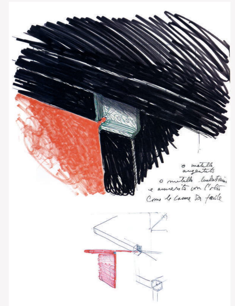
Study of the corner of Orseolo table sketch by Carlo Scarpa 1971-71

Laccato rosso/Red lacquered/ Rot matt lackiert/Rouge laquée matt