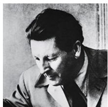
Gerrit Thomas Rietveld

In Gerrit Thomas Rietveld nato a Utrecht il 24 giugno 1888, sembrano emergere due personalità, così ben definite da far sembrare la sua opera come non appartenente ad un unico artista. La prima, quella dell'ebanista artigiano del linguaggio primordiale, che reinventa sedie e mobili come se prima di lui nessuno ne avesse mai costruiti, seguendo un suo codice strutturale del tutto personale; la seconda, quella dell'architetto dalle formule eleganti, impegnato ad affermare nel contesto dell'architettura europea la tesi razionalistica e neoplasticista. Le due attività si alternano, si sovrappongono e si fondono in una perfetta osmosi, dipanandosi in una logica sequenza.