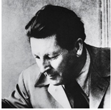
Gerrit Thomas Rietveld

In Gerrit Thomas Rietveld nato a Utrecht il 24 giugno 1888, sembrano emergere due personalità, così ben definite da far sembrare la sua opera come non appartenente ad un unico artista. La prima, quella dell'ebanista artigiano del linguaggio primordiale, che reinventa sedie e mobili come se prima di lui nessuno ne avesse mai costruiti, seguendo un suo codice strutturale del tutto personale; la seconda, quella dell'architetto dalle formule eleganti, impegnato ad affermare nel contesto dell'architettura europea la tesi razionalistica e neoplasticista. Le due attività si alternano, si sovrappongono e si fondono in una perfetta osmosi, dipanandosi in una logica sequenza.