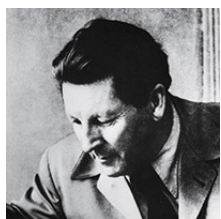
Gerrit Thomas Rietveld

In Gerrit Thomas Rietveld nato a Utrecht il 24 giugno 1888, sembrano emergere due personalità, così ben definite da far sembrare la sua opera come non appartenente ad un unico artista. La prima, quella dell'ebanista artigiano del linguaggio primordiale, che reinventa sedie e mobili come se prima di lui nessuno ne avesse mai costruiti, seguendo un suo codice strutturale del tutto personale; la seconda, quella dell'architetto dalle formule eleganti, impegnato ad affermare nel contesto dell'architettura europea la tesi razionalistica e neoplasticista. Le due attività si alternano, si sovrappongono e si fondono in una perfetta osmosi, dipanandosi in una logica sequenza.