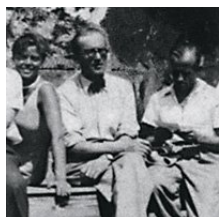
Le Corbusier, Pierre Jeanneret, Charlotte Perriand

Nel 1922 Le Corbusier dà inizio ad una attività professionale presso il nuovo atelier di rue de Sèvres a Parigi insieme al cugino Pierre Jeanneret col quale condivide ricerche e criteri di progettazione con intesa profonda e duratura, testimoniata per tutta la vita.