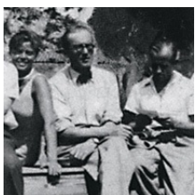
Le Corbusier, Pierre Jeanneret, Charlotte Perriand

Nel 1922 Le Corbusier dà inizio ad una attività professionale presso il nuovo atelier di rue de Sèvres a Parigi insieme al cugino Pierre Jeanneret col quale condivide ricerche e criteri di progettazione con intesa profonda e duratura, testimoniata per tutta la vita.