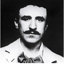
Charles Rennie Mackintosh

Charles Rennie Mackintosh est né à Glasgow en 1868 et mourut à Londres le 10 décembre 1928. Sa personnalité est sans aucun doute l'une des plus singulières parmi celles qui caractérisent l'époque immédiatement antérieure au Mouvement Moderne.