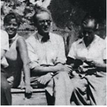
Le Corbusier, Pierre Jeanneret, Charlotte Perriand

En octobre 1927, ils engagent une Jeune architecte, Charlotte Perriand, qui à l'époque bénéficie d'une certaine notoriété. Leur collaboration durera jusqu'en 1937, et se révélera extrêmement fructueuse, notamment pour ce qui concerne la création de meubles. La complicité entre les trois auteurs favorisera la production d'objets d'une qualité artistique et culturelle exceptionnelle. Elle aura également des effets bénéfiques sur leur activité professionnelle.