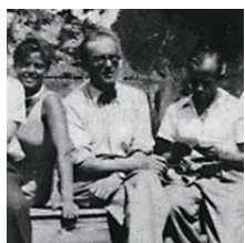
Le Corbusier, Pierre Jeanneret, Charlotte Perriand

En octobre 1927, ils engagent une Jeune architecte, Charlotte Perriand, qui à l'époque bénéficie d'une certaine notoriété. Leur collaboration durera jusqu'en 1937, et se révélera extrêmement fructueuse, notamment pour ce qui concerne la création de meubles. La complicité entre les trois auteurs favorisera la production d'objets d'une qualité artistique et culturelle exceptionnelle. Elle aura également des effets bénéfiques sur leur activité professionnelle.