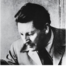
Gerrit Thomas Rietveld

In Gerrit Thomas Rietveld nato a Utrecht il 24 giugno 1888, sembrano emergere due personalità, così ben definite da far sembrare la sua opera come non appartenente ad un unico artista. La prima, quella dell'ebanista artigiano del linguaggio primordiale, che reinventa sedie e mobili come se prima di lui nessuno ne avesse mai costruiti, seguendo un suo codice strutturale del tutto personale; la seconda, quella dell'architetto dalle formule eleganti, impegnato ad affermare nel contesto dell'architettura europea la tesi razionalistica e neoplasticista. Le due attività si alternano, si sovrappongono e si fondono in una perfetta osmosi, dipanandosi in una logica sequenza.