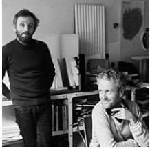
Ronan & Erwan Bouroullec

Ronan Bouroullec (born 1971) and Erwan Bouroullec (born 1976) have been working together for about twenty years now. Their collaboration is a permanent dialogue nourished by their distinct personalities and a shared notion of diligence with the intention to reach more balance and fineness. Their work has covered many fields ranging from the design of small objects as jewellery to spatial arrangements and architecture, from craftsmanship to industrial scale, from drawings to videos and photography. They have collaborated with leading design companies such as Vitra, Cassina, Artek, Danskina, Magis, Alessi, Galerie kreoo, Established & Sons, Axor Hansgrohe, Flos, Kvadrat, Glas Italia, Kartell, Kettal, Iittala, Cappellini, Ligne Roset, Nani Marquina, Mattiazzi, Mutina, Samsung and Hay. Designs of Ronan & Erwan Bouroullec are part of select international museums' permanent collections and several exhibitions have been devoted to their work including the Design Museum, London, the Museum of Contemporary Art, Los Angeles, the Centre Pompidou Metz, the Museum of Contemporary Art, Chicago, the Musée des Arts Décoratifs in Paris, the Vitra Design Museum or the FRAC Bretagne. The Bouroullec studio is located in Paris, and the whole team numbers around eight people. To discover more about Ronan & Erwan Bouroullec's work, please visit www.bouroullec.com