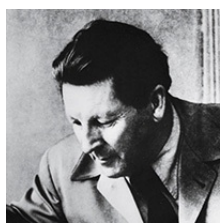
Gerrit Thomas Rietveld

In Gerrit Thomas Rietveld nato a Utrecht il 24 giugno 1888, sembrano emergere due personalità, così ben definite da far sembrare la sua opera come non appartenente ad un unico artista. La prima, quella dell'ebanista artigiano del linguaggio primordiale, che reinventa sedie e mobili come se prima di lui nessuno ne avesse mai costruiti, seguendo un suo codice strutturale del tutto personale; la seconda, quella dell'architetto dalle formule eleganti, impegnato ad affermare nel contesto dell'architettura europea la tesi razionalistica e neoplasticista. Le due attività si alternano, si sovrappongono e si fondono in una perfetta osmosi, dipanandosi in una logica sequenza.