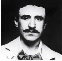
Charles Rennie Mackintosh

Charles Rennie Mackintosh nacque a Glasgow nel 1868 e morì a Londra il 10 dicembre 1928.