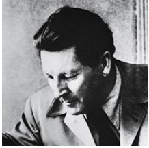
Gerrit Thomas Rietveld

In Gerrit Thomas Rietveld nato a Utrecht il 24 giugno 1888, sembrano emergere due personalità, così ben definite da far sembrare la sua opera come non appartenente ad un unico artista. La prima, quella dell'ebanista artigiano del linguaggio primordiale, che reinventa sedie e mobili come se prima di lui nessuno ne avesse mai costruiti, seguendo un suo codice strutturale del tutto personale; la seconda, quella dell'architetto dalle formule eleganti, impegnato ad affermare nel contesto dell'architettura europea la tesi razionalistica e neoplasticista. Le due attività si alternano, si sovrappongono e si fondono in una perfetta osmosi, dipanandosi in una logica sequenza.