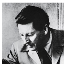
Gerrit Thomas Rietveld

In Gerrit Thomas Rietveld nato a Utrecht il 24 giugno 1888, sembrano emergere due personalità, così ben definite da far sembrare la sua opera come non appartenente ad un unico artista. La prima, quella dell'ebanista artigiano del linguaggio primordiale, che reinventa sedie e mobili come se prima di lui nessuno ne avesse mai costruiti, seguendo un suo codice strutturale del tutto personale; la seconda, quella dell'architetto dalle formule eleganti, impegnato ad affermare nel contesto dell'architettura europea la tesi razionalistica e neoplasticista. Le due attività si alternano, si sovrappongono e si fondono in una perfetta osmosi, dipanandosi in una logica sequenza.